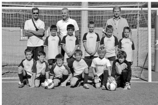
Ecco la squadra dei Pulcini 2002 del GSO San Giovanni

Noi che giocavamo nel G.S. Remo Manzoni, noi che si faceva 'San Giovanni contro Varigione', noi che i più bravi giocavano contro l'Olate, noi che ci riempivamo le Tapa Sport di sabbia, fino a che il nero diventava bianco e che veramente pulite non diventavano mai.